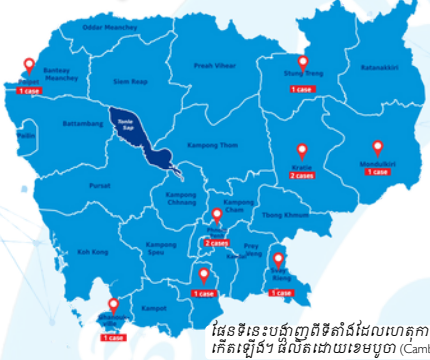
ផែនទីនេះបង្ហាញពីទីតាំងដែលហេតុការណ៍បាន កើតឡើង។ ផែនទីនេះមិនមែនជាផែនទីផ្លូវចរាចរណ៍ (Cambodia)

របាយការណ៍ប្រចាំត្រីមាស ខែមករា-មីនា ឆ្នាំ២០២៤ ដែលបានកត់ត្រាដោយខេមបូឌា ផ្តល់នូវ ទិដ្ឋភាពទូទៅនៃស្ថានភាពបច្ចុប្បន្នទាក់ទងនឹងវិស័យសារព័ត៌មាននៅក្នុងប្រទេសកម្ពុជា។ របាយ ការណ៍នេះបានកត់សម្គាល់ថាមាន ១០ ករណីនៃការយឺតយ៉ាវ ដែលករណីទាំងនេះពាក់ព័ន្ធនឹងអ្នក សារព័ត៌មាន ១៨នាក់។ ៧ ករណីជាការគំរាមកំហែងផ្លូវច្បាប់, ១ ករណីជាអំពើហិង្សាខាងរាងកាយ និង ២ ករណីជាការរឹតបន្តឹងចំពោះអ្នកសារព័ត៌មានពីការរាយការណ៍នៅទីសាធារណៈ។